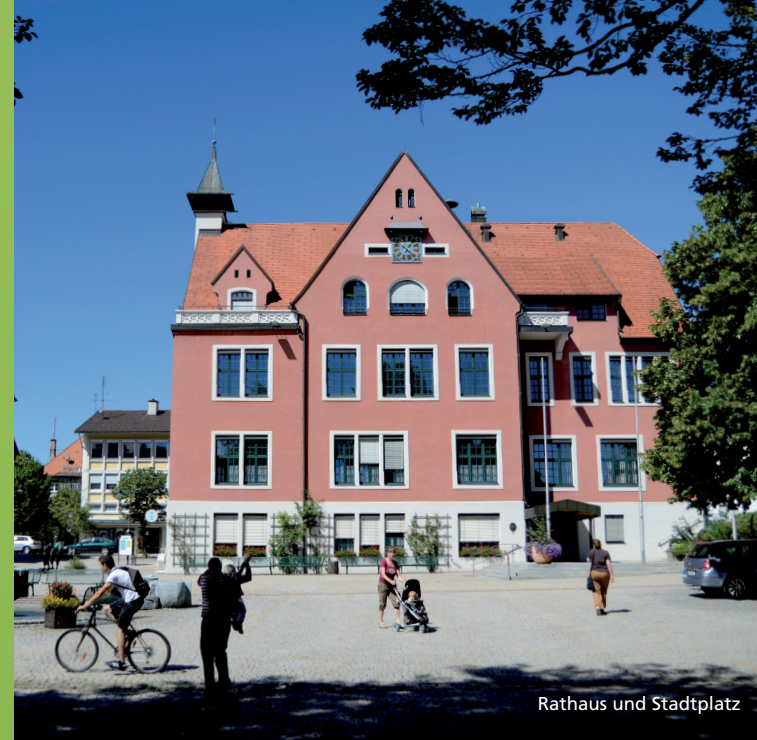
Rathaus und Stadtplatz

Ihre Tradition als einstmals führende Hutmacherstadt sowie als wichtiger Standort der Allgäuer Käseproduktion pflegt die Stadt alljährlich am Lindenerger Hut-Tag (im Frühling) und anlässlich des Internationalen Käse- und Gourmetfestes (letzter Fr/Sa im August).